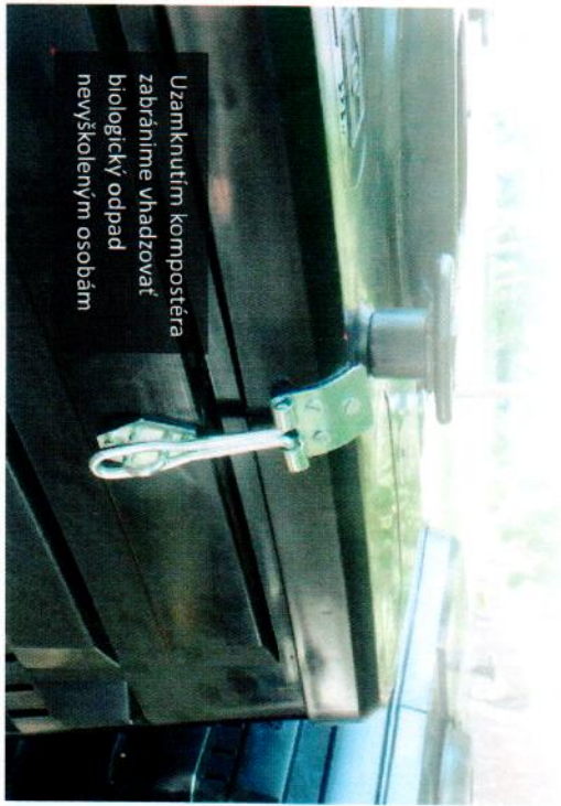
Uzamknutím kompostéra zabránime vhadzovať biologický odpad nevyškoleným osobám

Akéhokoľvek surové rastlinné biologické odpady z domácnosti, záhrady a údržby verejnej a súkromnej zelene (napr. zvyšky z pestovania, čistenia a úpravy ovocia a zeleniny, tráva, listie, drevný odpad).